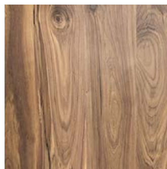
Nogal Americano Harmony